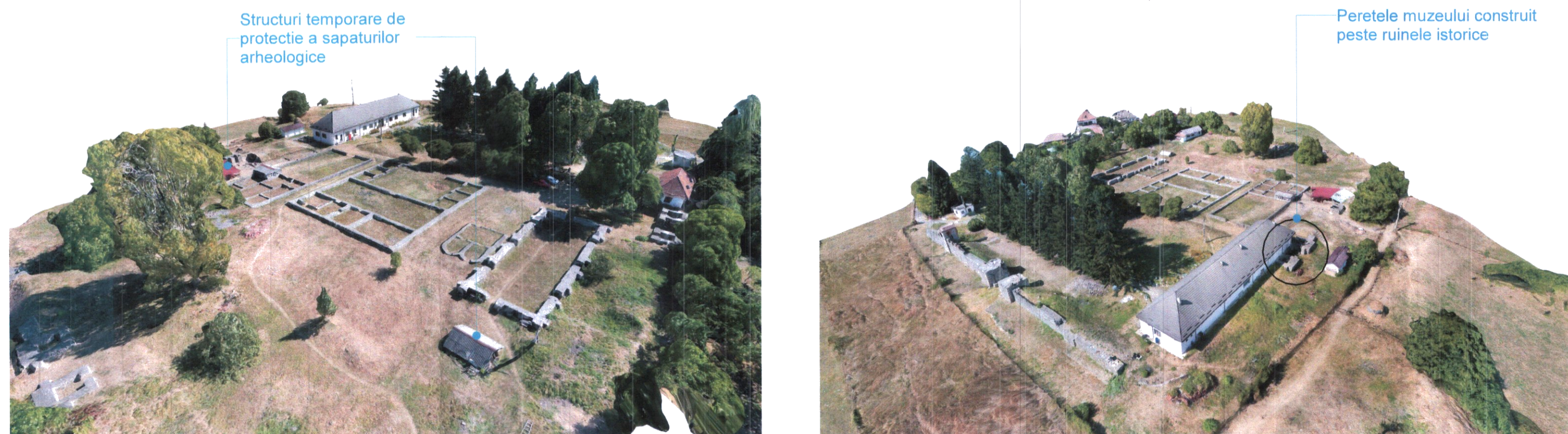
Plan de Situatie Existent 1 : 500